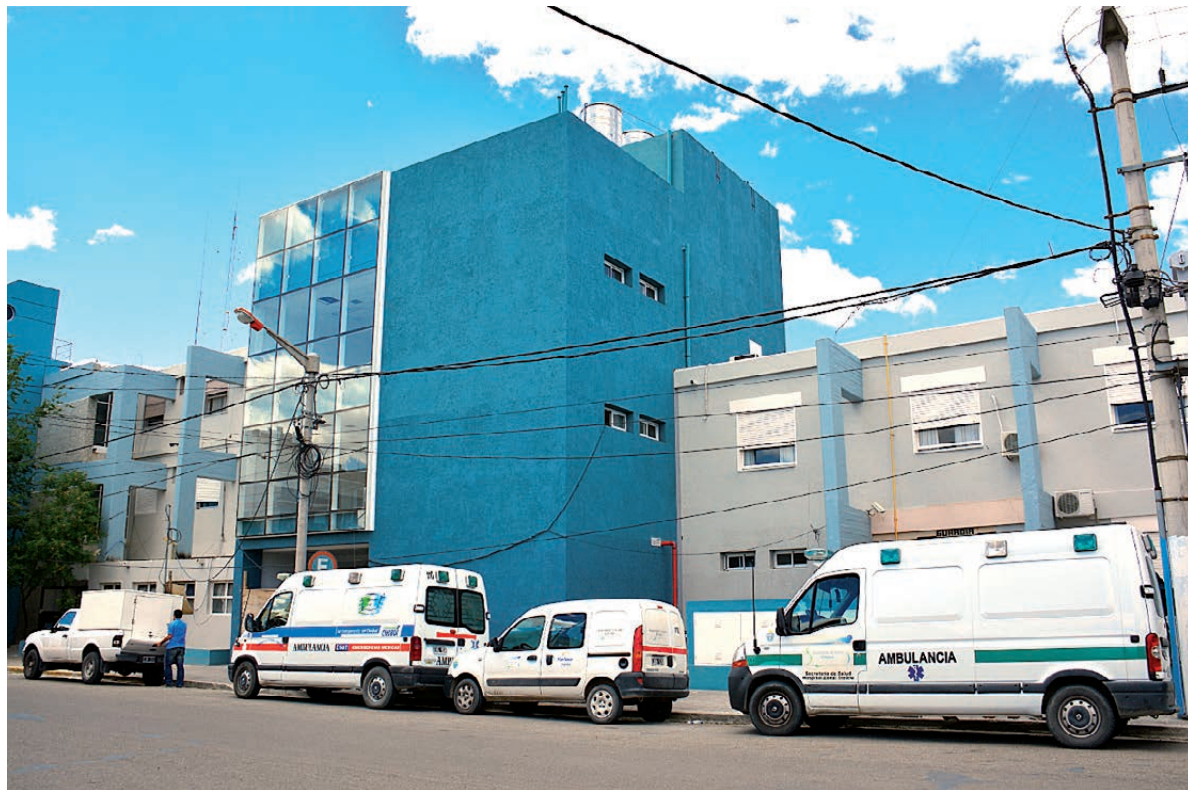
EL ACTUAL EDIFICIO DEL HOSPITAL ZONAL DE TRELEW, ADEMÁS, 11 CENTROS DE SALUD.